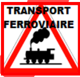
Illustration par la présentation d'un ouvrage relatant le combat syndical CGT des Ducellier !

Pas de Service Public, pas d'emplois privés » ! Moins d'emplois « privés », moins de Service Public !